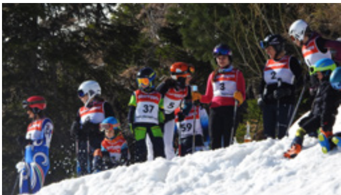
Groß und klein beim Vereinsrennen