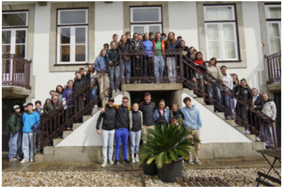
Die Gruppe in Porto

04:00 Uhr Abfahrt in Bozen. Um 6 ein überbeuertes, aber köstliches Autobahngipfele zu 3. (schlaue Entscheidung). Flughafen, zittern, zwei Stunden Dann fliegen wir vollkommen durch die Wolken, Turbulenzen – auf der Fahrt, und beim Handyspiel mit der Sitznachbarin, aber dann sind wir da. Hello Porto, hello Portugal. Urlaub, Sommer, Strand – zumindest fast. Das Wetter nimmt unsere Erwartungen dann doch. Zwar süß, aber nicht aus Zucker. Dauerregen – check. Metrofahrt, Buscart mit typisch portu- giesischem Muster. Kurz Realitycheck: Wir sind in Porto, wirklich! Essen – endlich. Dann in eine Billiardbar (wär' schon bald das Stammlokal). Und endlich schlafen. Kalt, zu kalt – Hostel, im Frost – doch Decken – zum Glück. Sightseeing, Fotochallenge, Bibliothek- besuch. Ästhetik gesucht, in Harry-Potter-Buchgeschäft, Bücher mit Gold bestickt, versteckt Blauporzellanmosaik des hollywoodrei- fen Bahnhofs, spontane Polonäse – nicht ganz erfolglos, vor dem Regen flüchten, zufällig zum Shoppen, Kleiderprobe zum Lachen, Talks zu Menschen, kennt man kaum, zumindest noch nicht. Und dann am Nachmittag auf dem Dom über der verregneten, doch charmanten Stadt einen windigen Atemzug Freiheitsluft tanken, und sich bedanken für (gezählte) 4 Sonnenstrahlen. Insgesamte Sonnenbrillnutzung der Woche: ca. 8 Minuten Laut Google Maps erreichen wir das Ziel in 2 Stunden. Angezogene Pullover: alle, die mit sind, und noch 3. Regenschirmeinsatz: gesamte restli- che Zeit.