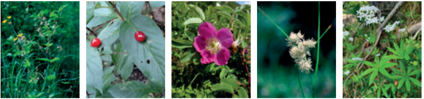
Abb. 3: Nessel-Ehrenpreis (1); Alpen-Heckenkirsche (2, mit reifen Früchten im Herbst); Hängefrüchtige Rose (3, die „einzige“ Rose ohne Dornen); Schnee-Simse (4); Waldmeister (5)

Krainer Wolfsmilch ( Euphorbia carniolica , Abb. 2_3). Auch der Frauenschuh ( Cypripedium calceolus , Abb. 2_4) ist hier zu finden. Als Kalkschuttzeiger sind der Kalk-Alpendost ( Adenostyles alpina , Abb. 2_5) und der Nessel-Ehrenpreis ( Veronica urticifolia , Abb. 3_1) zu nennen. Unter den Sträuchern findet man häufig die Alpen-Heckenkirsche ( Lonicera alpigena , Abb. 3_2) und die Hängefrüchtige Rose ( Rosa pendulina , Abb. 3_3). Die Artenvielfalt in diesem Mischwald ist erstaunlich im Vergleich zu einem reinen Buchenwald, der als „Hallenwald“ meistens ganz we-