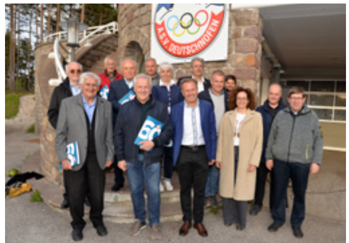
Ehrengäste und ehemalige Funktionäre des ASV Deutschnofen