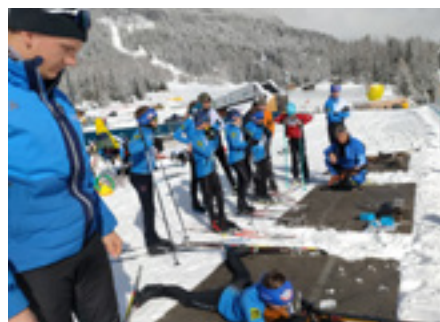
Beim Biathlon in Martell