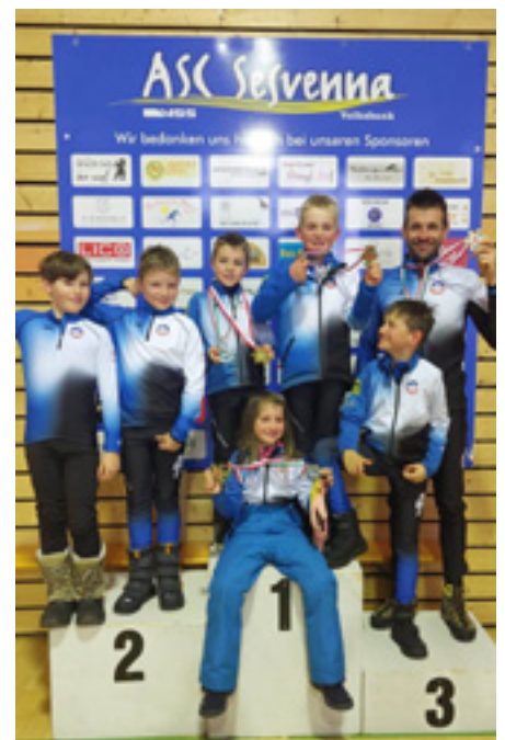
Raiffeisencuprennen in Schlinig

Ein großes Dankeschön gilt allen freiwilligen Helfern und Betreuerinnen sowie allen Sponsoren, die uns jederzeit tatkräftig unterstützten und es auch zukünftig bitte machen werden.