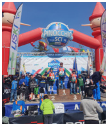
Julius Kasslatter Pinocchio sugli Sci 2. Platz